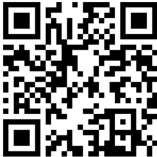
Videodemo: Roland TR-808

Einer der größten Hits, in denen die 808 exponiert eingesetzt wird, ist Marvin Gayes „Sexual Healing“. Darüber hinaus kann man sie auf vielen Phil-Collins- und Genesis-Aufnahmen hören. Auf Whitney Houstons „I Wanna Dance with Somebody (Who Loves Me)“ ist die berühmte Cowbell zu hören; der Song beginnt mit einem mehrfach wiederholten kurzen Pattern der 808 unisono (bd, claps, cowbell). In Britney Spears' Song Break the Ice wird mittels eines kurzen Breaks das Herzklopfen mit der Basstrom der 808 verglichen. Die 808 genießt in der Geschichte der elektronischen Musik einen kaum vergleichbaren Kultstatus.