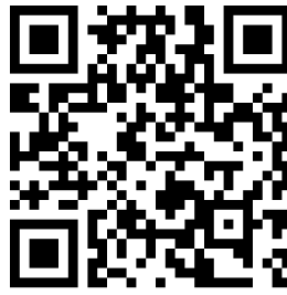
Über die Zulu Nation