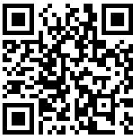
Über Afrika Bambaataa

Seit einer Reise auf den afrikanischen Kontinent nennt er sich Afrika Bambaataa . Seinem von Gewalt geprägten Umfeld setzt er eine Organisation entgegen, die sich den positiven Werten Peace, Love, Unity and Having Fun verschreibt – die Zulu Nation .